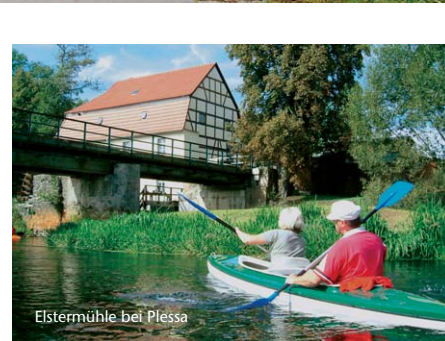
Elstermühle bei Plessa

Der Schwarze-Elster-Radweg ist eine besondere Empfehlung in der Lausitz. Die Lausitz bietet eine Landschaft, wie geschaffen für Radler, insbesondere für diejenigen, die das erholsame Radeln bevorzugen. Die Schwarze Elster entspringt am Hochstein beim Ort Kindisch im Lausitzer Bergland und mündet nach 188 km bei Elster (Sachsen-Anhalt) in die Elbe. Über 126 km begleitet der Schwarze-Elster-Radweg den Fluß vom Geierswalder See bis zur Elbe und ist damit eine durchgängig für Radfahrer gebaute Verbindung zwischen dem entstehenden Lausitzer Seenland und der Elbe. Das Lausitzer Seenland ist eine Landschaft im Wandel. Die vielen entstehenden Seen zeugen vom ehemaligen Braunkohleabbau in der Region. Wie bereits der Senftenberger See, der schon viele Jahre mit seinem vielfältigen Erholungs- und Wassersportangebot Gäste anzieht, locken auch der Partwitzer-, Sedlitzer- und Geierswalder See mit besonderen Aktivangeboten. Am Flusslauf der Schwarzen Elster entlang erfährt man eine Auen- und Wiesenlandschaft, wie sie seit Jahrhunderten hier anzutreffen ist. Als ein Refugium der Natur mit vielen geschützten Pflanzen bietet der Fluss Vorkommen vieler Fischarten wie Barbe, Plötze und Zander. Entlang des Elsterdammes erstrecken sich mehrere Altarmgewässer, in denen der Biber und der Fischotter heimisch sind.